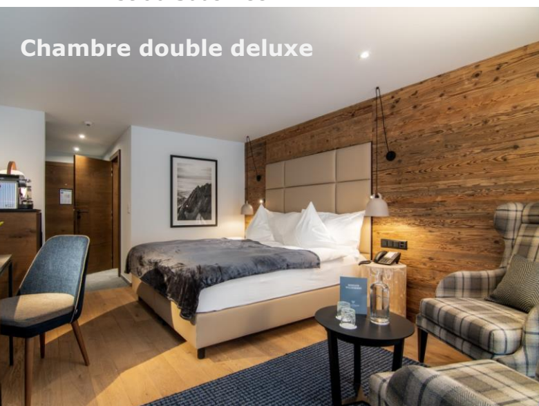
Chambre double deluxe